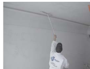
Gletovanje plafona bez skele i merdevina pomoću teleskop gleterice (leptira).