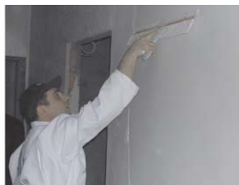
Gletovanje zidova širokom gletericom (leptirom) do perfektne glatkoće.