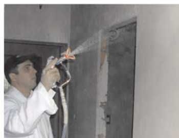
Precizno prskanje Riplana na zidove i plafone pomoću pištolja (airless) bez upotrebe kompresora.