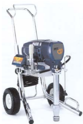
"Auto clean" - samočišćenje mašine