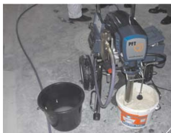
Postavljanje kante sa pastoznom glet masom ispod usisnika Graco Mark V mašine.